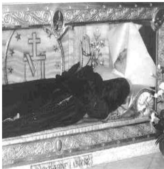
Santa Catalina Labouré descansa en Rue du Vac, París su cuerpo incorrupto

Después de haber sido por 10 años Jesuita, con permiso sale de la orden y funda en 1848, las religiosas y las misiones de Ntra. Sra. de Sión. En solo los diez primeros años Ratisbone consiguió la conversión de 200 judíos y 32 protestantes. Trabajó lo indecible en Tierra Santa, logrando comprar el antiguo pretorio de Pilato, que convirtió en convento e Iglesia de las religiosas. También consiguió que estas religiosas fundasen un hospicio en Ain-Karim, donde murió santamente en 1884 a los 70 años